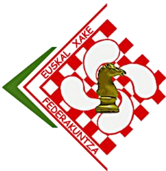
FEDERACIÓN VASCA DE AJEDREZ